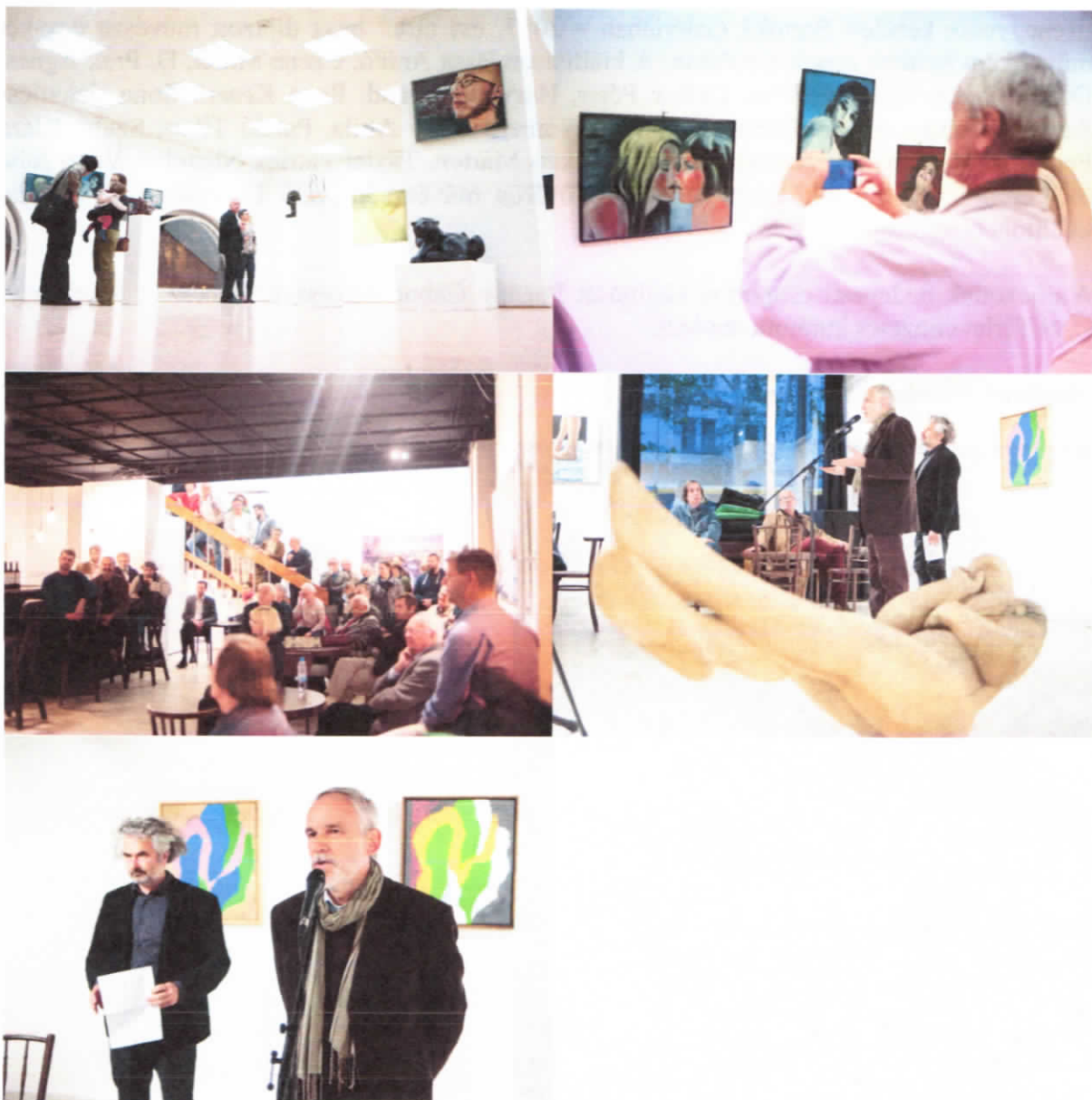
Hódmezővásárhely, 2018. május 10.