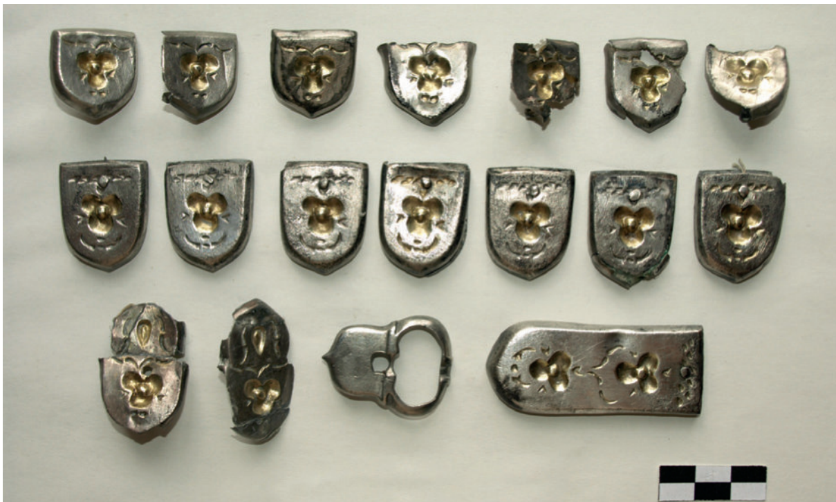
9. kép: Keszthely-Fenekpuszta, Horreum 15. sír.

Szegvár-Oromdűlő 110. sír: A kettős temetkezésből három préselt bronzveret került elő a felszerelő bronzszegecsekkel együtt. 137 A veret közepén, oldalán álló háromszög alakban elhelyezett, egymást metsző